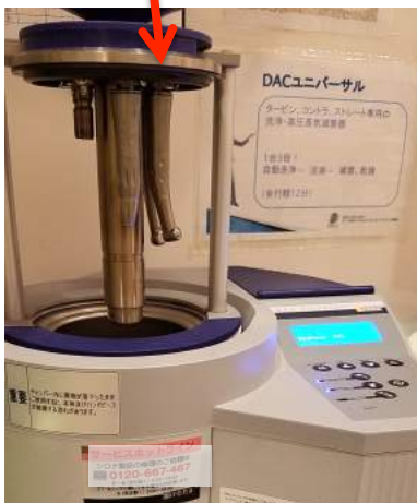
DACユニバーサルによるメンテナンスの流れ

バー（歯や被せ物を削る道具）も使用後には洗浄、パックに入れ、その後滅菌しております。