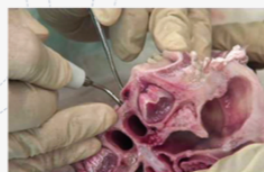
サイナスリフト時の トラブル対応