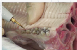
サイナスリフト (ラテラルアプローチ)